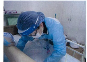
訪問看護ステーションおおみち (大阪府)