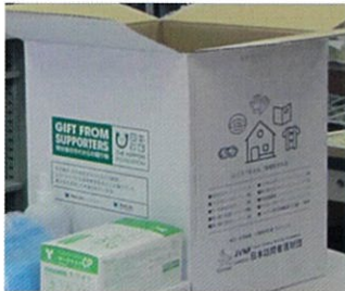
N訪問看護ステーション (S県)