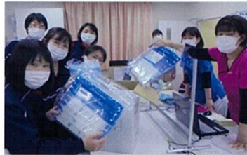
訪問看護ステーション喜 (静岡県)