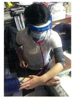
おもて参道訪問看護ステーション (東京都)