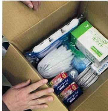
K訪問看護ステーション (D県)