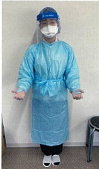
訪問看護ステーションハートフリーやすらぎ (大阪府)